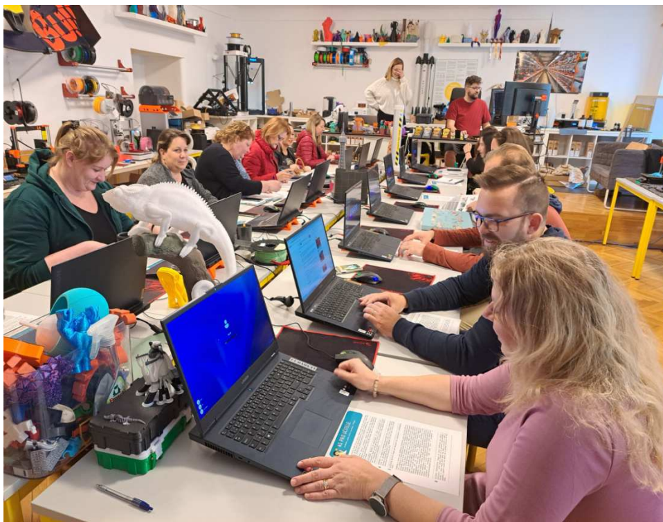
Digitální vzdělávání v Domě dětí a mládeže v Písku