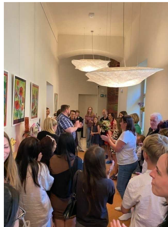
Vernisáž výstavy prací žáků ZŠ ve spolupráci se ZUŠ