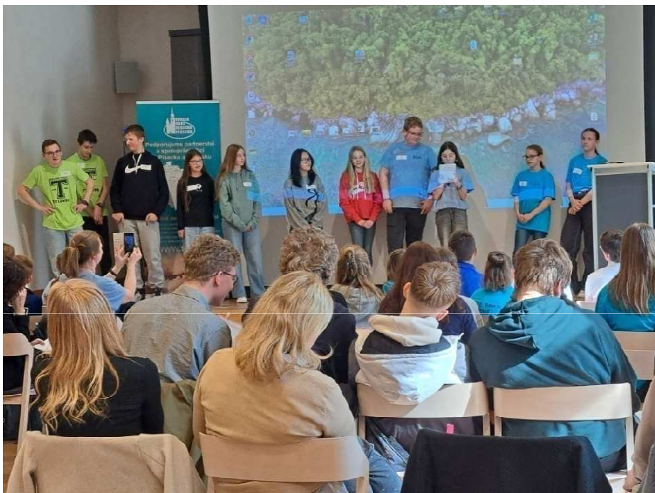
Konference žákovských parlamentů a jejich setkání se místostarostkou města Písek.